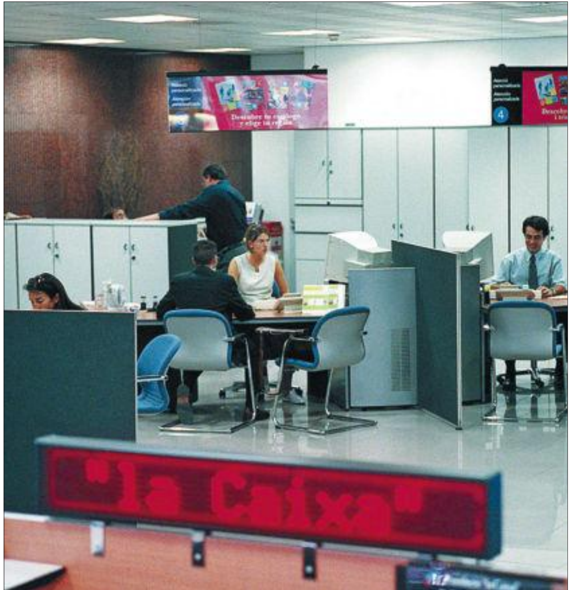
Interior de una sucursal de La Caixa en Barcelona.